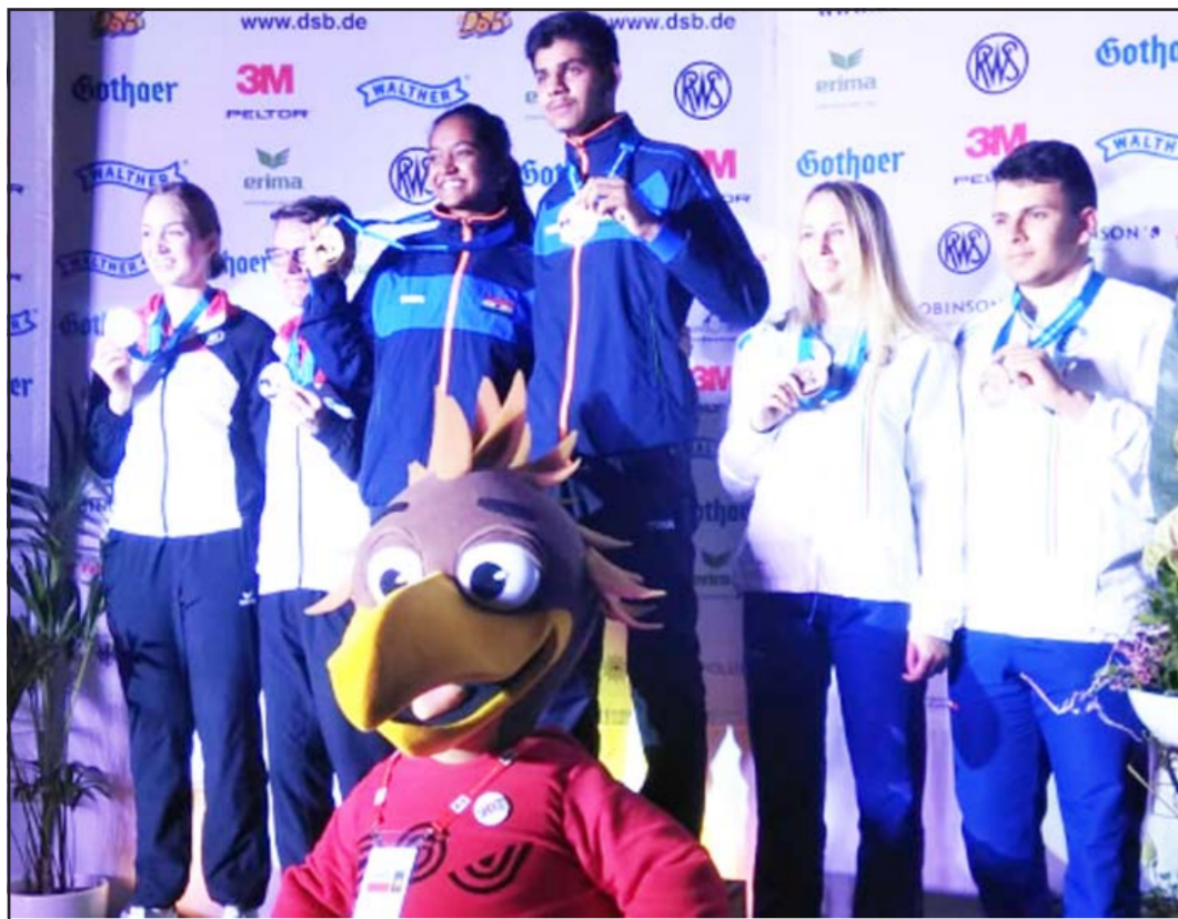
Gujarat shooter Elavenil Valarivan & Divyansh win a mixed air rifle team gold with a world record score of 498.6